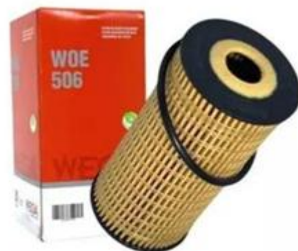
Foto ilustrativa Filtro WOE506