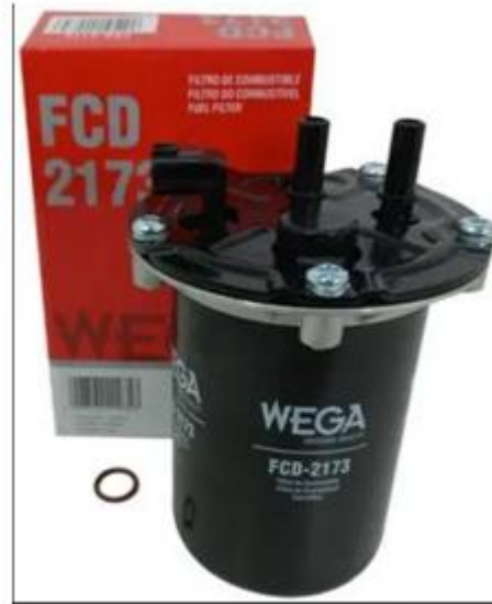
Foto ilustrativa Filtro comb. FCD2173