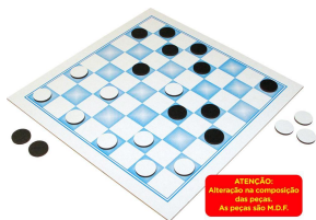
Jogo de Damas