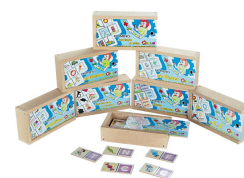
Dominó Kit Alfabetização