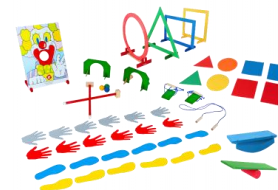
Linha de Movimento 2