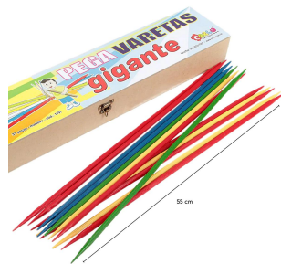
Pega Varetas Gigante