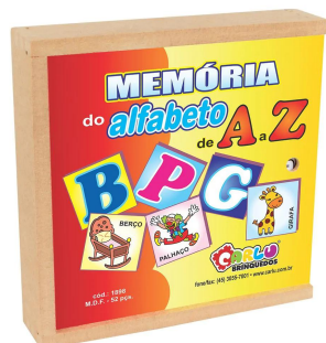
Memória do Alfabeto A a Z