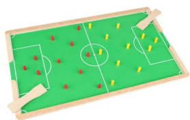
Futebol de Pinos