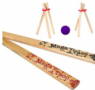
Taco de Bets