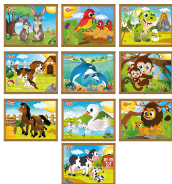
Quebra Cabeça Animais e Filhos