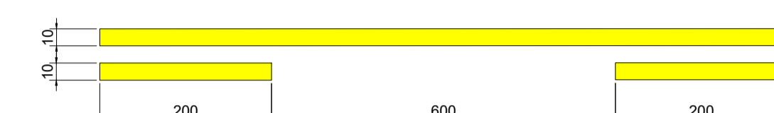
MODELO II FAIXA DUPLA CONTÍNUA E TRACEJADA