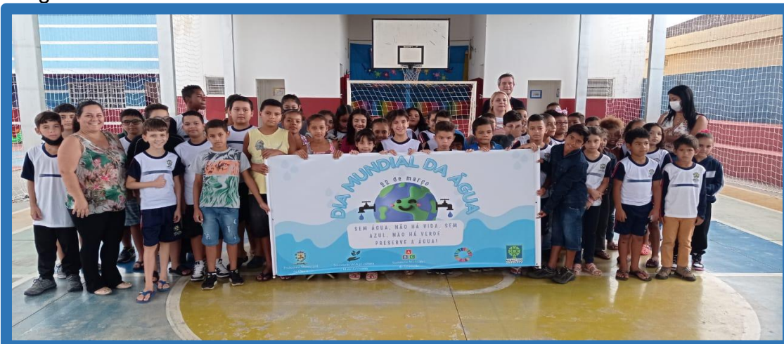
Imagem 05 - Alunos do 4º e 5º ano.