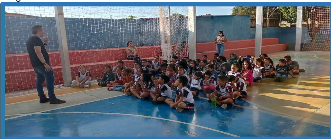
Imagem 04 - Palestra ministrada aos alunos do 4º e 5º ano.