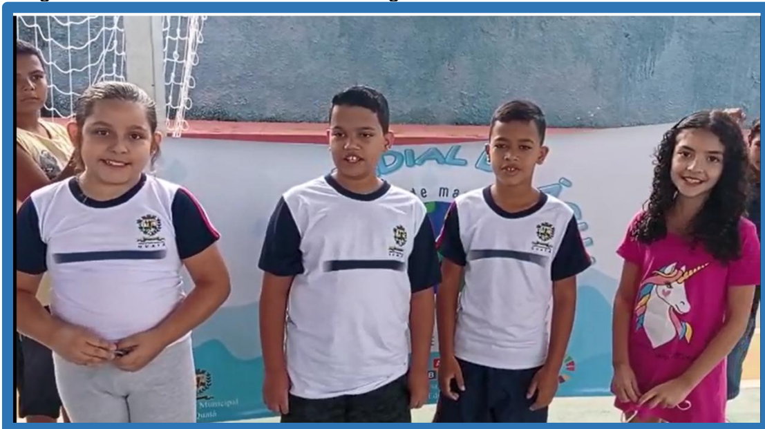
Imagem 06 - Trecho de um dos vídeos gravados com os alunos.