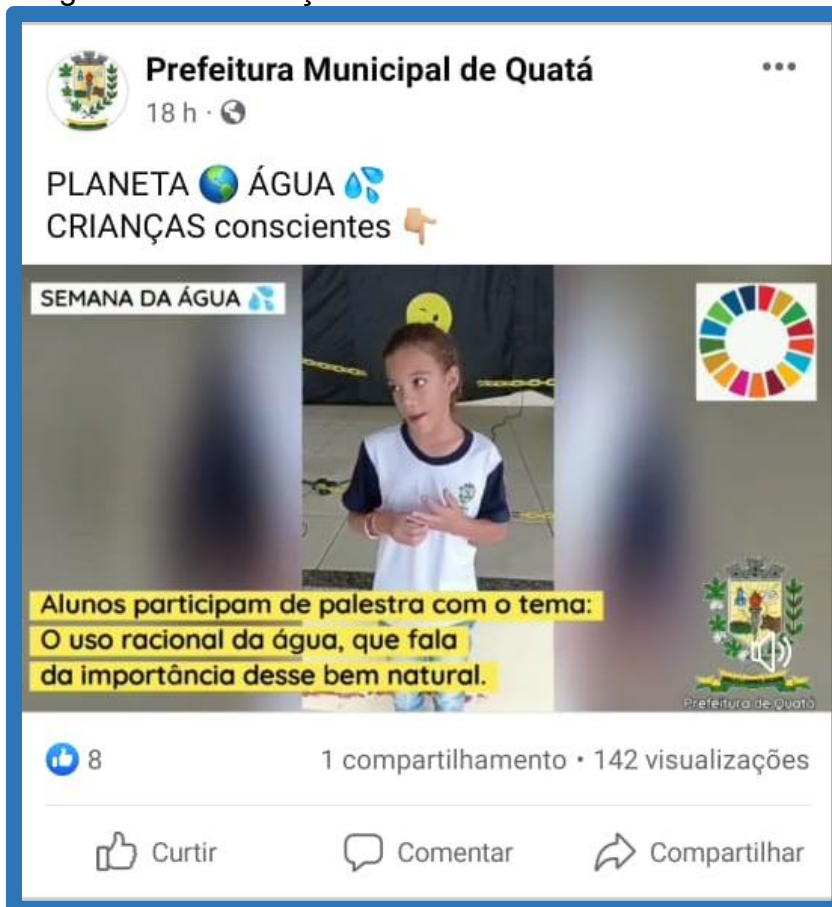
Imagem 01 - Publicação no Facebook.

Disponível em: https://www.facebook.com/watch/?v=400184858261357&extid=CL-UNK-UNK-UNK-AN_GK0T-GK1C&ref=sharing .